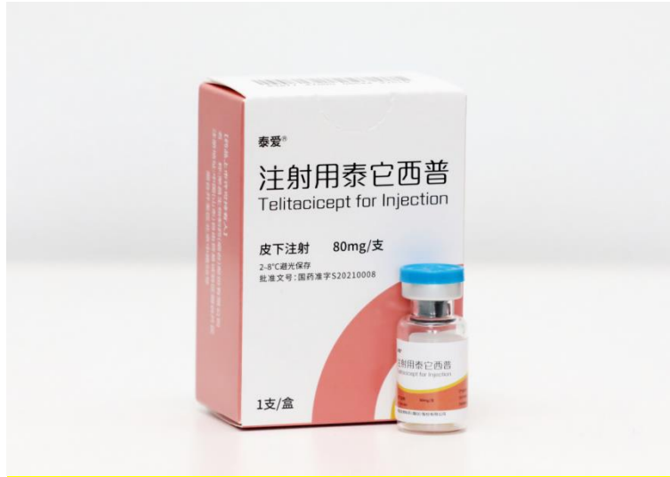
图一：注射用泰它西普

欧洲等国家和地区的授权，得到了国家“十一五”、“十二五”、“十三五”期间“重大新药创制”科技重大专项支持，其用于治疗系统性红斑狼疮的新药上市申请经优先审评审批程序，于 2023 年 11 月在中国由附条件批准转为完全批准。