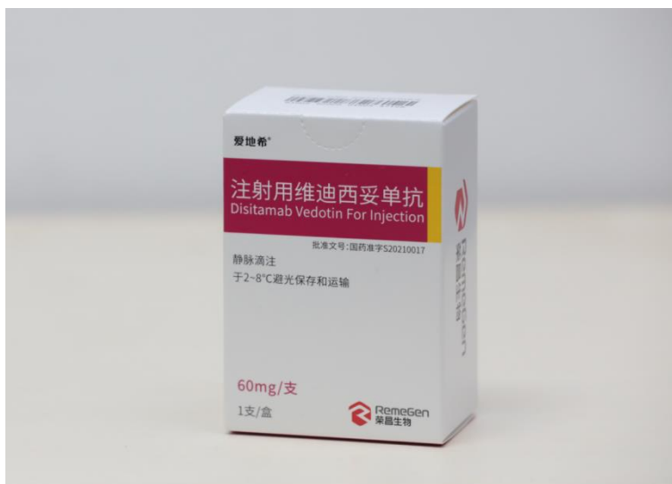
图二：注射用维迪西妥单抗