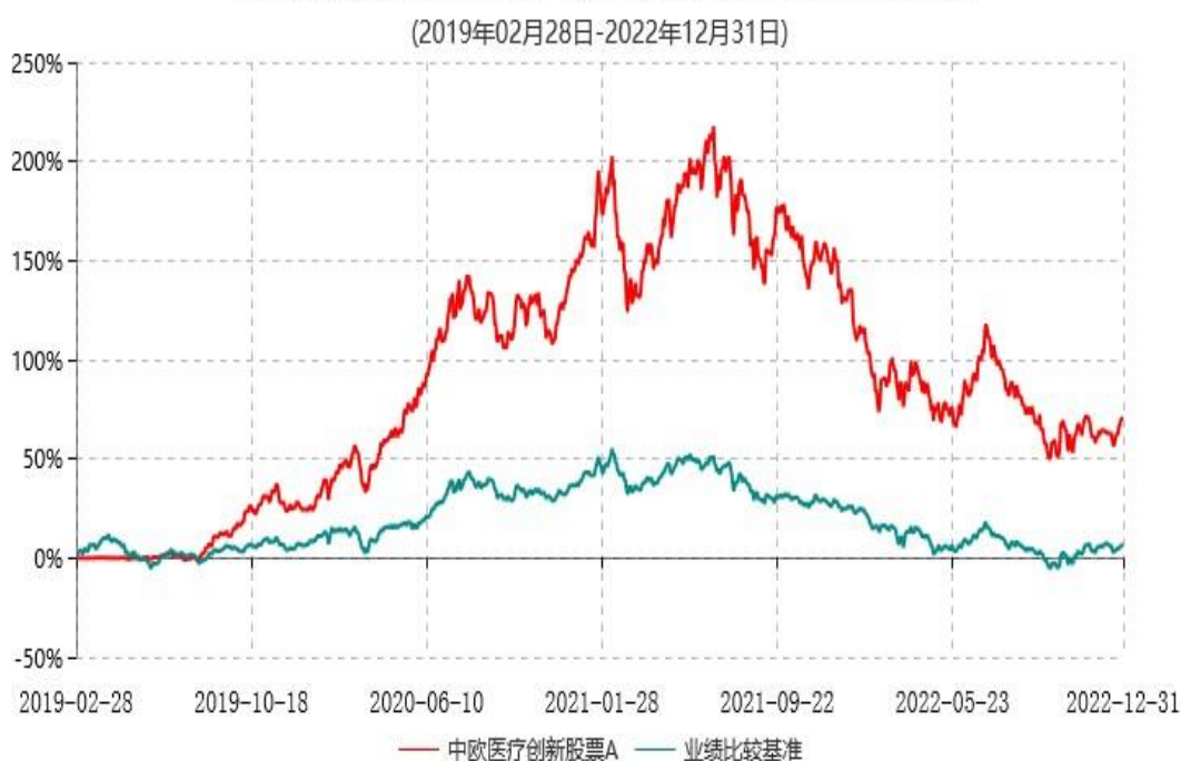
中欧医疗创新股票A累计净值增长率与业绩比较基准收益率历史走势对比图